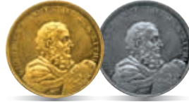
Władysław Jagiełło (1386-1434)