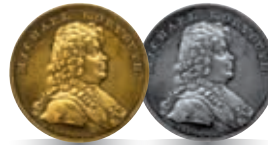
Michał Korybut Wiśniowiecki (1669-1673)