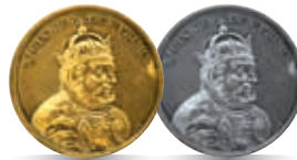
Zygmunt I Stary (1506-1548)