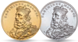
Kazimierz Wielki (1333-1370)