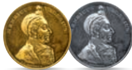
Henryk Walezy (1573-1575)