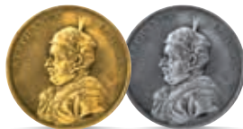
Stefan Batory (1576-1586)