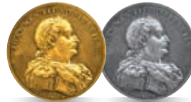
Jan III Sobieski (1674-1696)