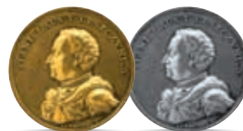
Stanisław Leszczyński (1705-1709, 1733-1736)