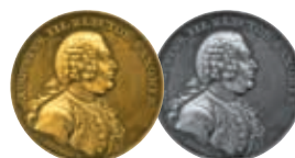
August III Sas (1733-1763)