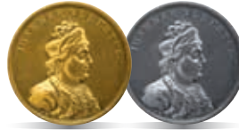
Jan Olbracht (1492-1501)