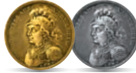
Władysław Warneńczyk (1434-1444)