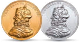
Wacław II Czeski (1291-1305)