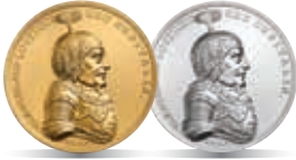
Władysław Łokietek (1320-1333)