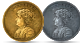
Aleksander Jagiellończyk (1501-1506)