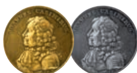
Jan Kazimierz Waza (1648-1668)