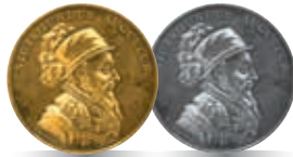
Zygmunt August (1548-1572)