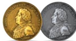
August II Mocny (1697-1706, 1709-1733)