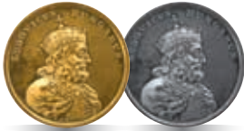
Ludwik Węgierski (1370-1382)