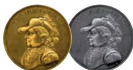
Władysław IV Waza (1632-1648)