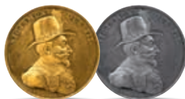
Zygmunt III Waza (1587-1632)