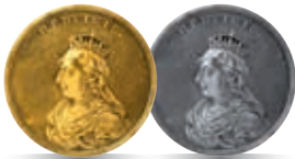
Jadwiga Andegaweńska (1384-1399)